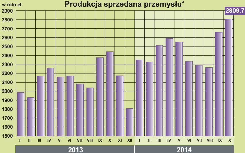
Produkcja sprzedana przemysłu a