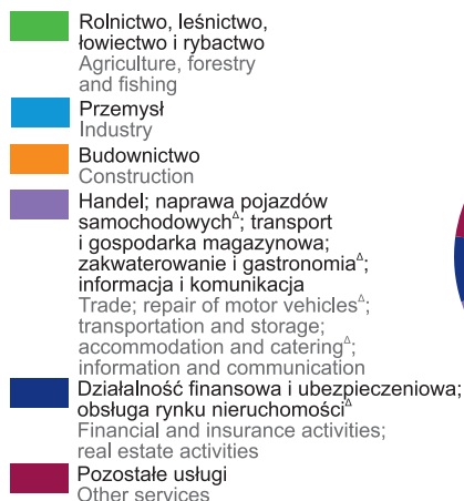
CHART 1 (84). GROSS VALUE ADDED BY KIND OF ACTIVITY (current prices)