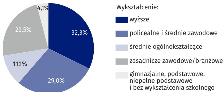
Wykres 1. Struktura ludności w wieku 15-89 lat aktywnej zawodowo według poziomu wykształcenia w 4 kwartale 2021 r.

Najwyższy poziom aktywności zawodowej odnotowano wśród osób z wykształceniem wyższym (82,4%), a najniższy – z wykształceniem co najwyżej gimnazjalnym (14,9%)