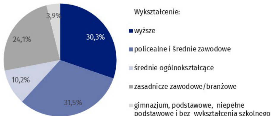
Wykres 1. Struktura ludności w wieku 15-89 lat aktywnej zawodowo według poziomu wykształcenia w 1 kwartale 2022 r.